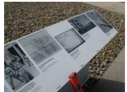
Abb. 35: Infotafeln Außenwege