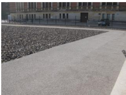
Abb. 27: Rundweg