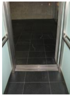
Abb. 19: Aufzug