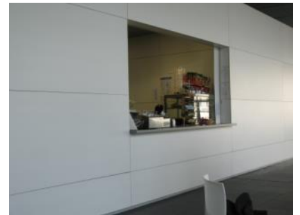
Abb. 17: Cafeteria