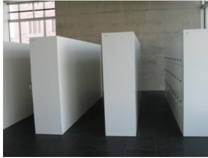
Abb. 10: Schließfächer (Kassenbereich)