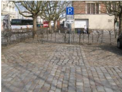
Abb. 2: Parkplatz (Martin-Gropius-Bau)