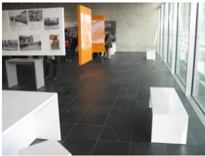
Abb. 12: Ausstellungsbereich