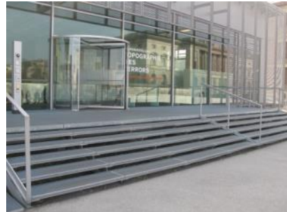
Abb. 6: Treppe (Eingangsbereich)