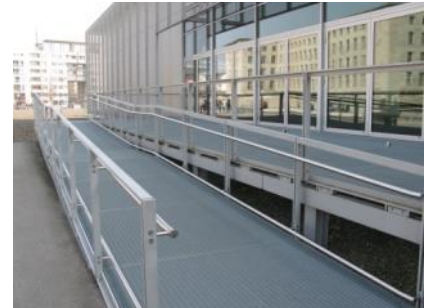
Abb. 7: Rampe (Eingangsbereich)