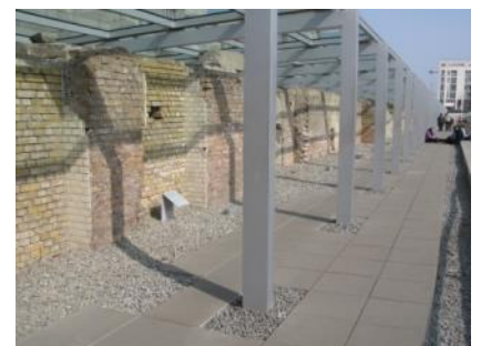
Abb. 26: Ausstellungsgraben