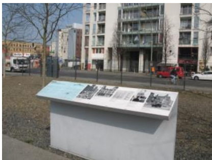
Abb. 33: Infotafeln Außenwege