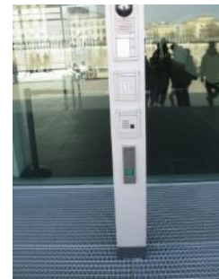
Abb.8: Bedienelemente (Automatiktür)