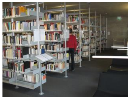
Abb. 22: Bibliothek