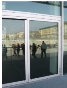
Abb. 7: Eingangstür (Automatiktür)