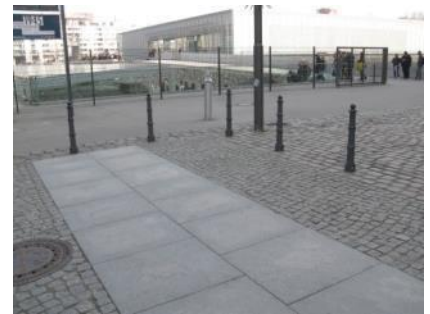
Abb. 4: Eingangsbereich Niederkirchnerstr. (außen)