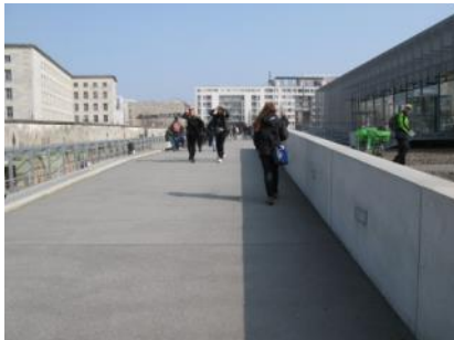
Abb. 5: Außenweg zum Gebäude