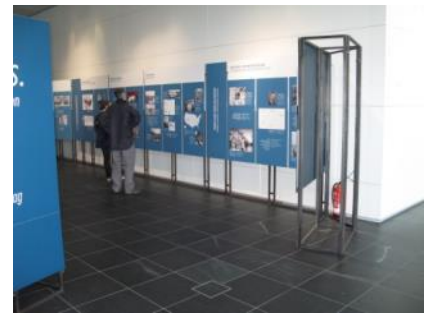
Abb. 14: Ausstellungsbereich