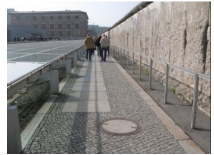
Abb.32: Außenweg „Berliner Mauer“