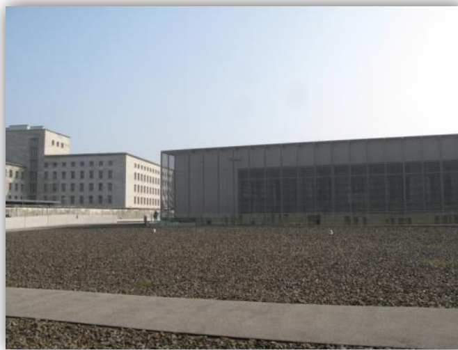
Abbildung 1: „Topographie des Terrors“