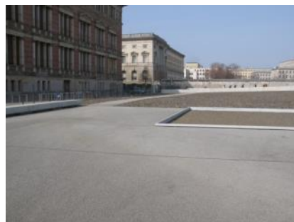
Abb. 28: Rundweg