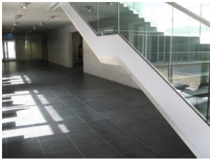
Abb. 18: Treppenhaus