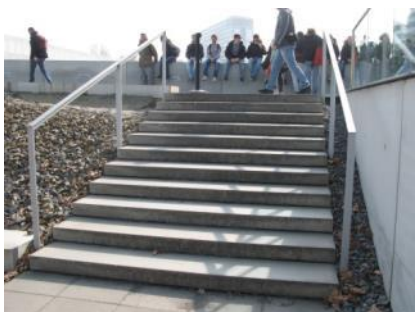
Abb. 24: Treppe zum Ausstellungsgraben