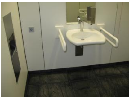
Abb. 21: WC