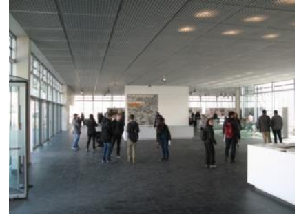
Abb. 11: Ausstellungsbereich