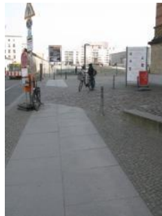
Abb.3: Weg vom Parkplatz zum Eingangsbereich