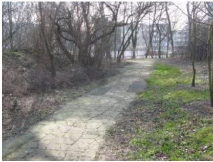
Abb. 30: Außenweg (Abschnitt Autodrom)