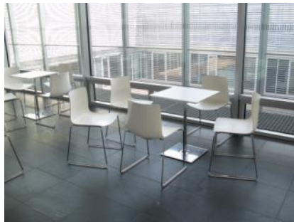
Abb. 16: Cafeteria