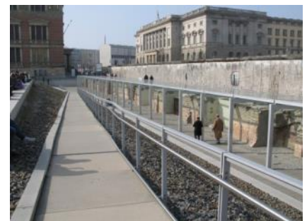
Abb. 23: Rampe zum Ausstellungsgraben