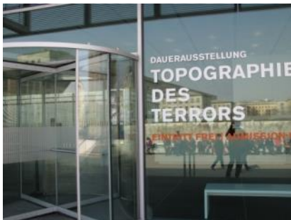
Abb. 6: Eingangstür (Rotationstür)