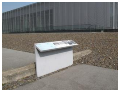
Abb. 34: Infotafeln Außenwege