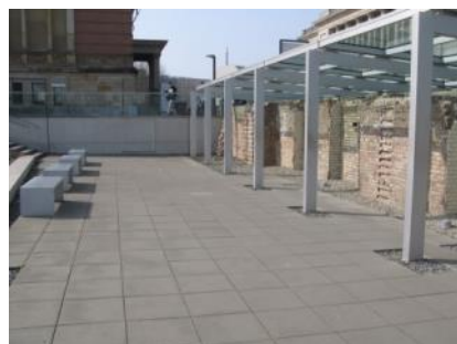
Abb. 25: Ausstellungsgraben