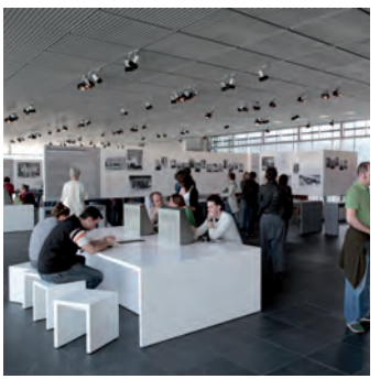
L'exposition permanente avec panneaux bilingues (allemand/anglais) se consacre aux principaux organismes de répression du III e Reich (SS et police) et aux crimes qu'ils ont commis dans toute l'Europe occupée. Elle présente le système de terreur mis en place par le régime nazi ainsi que les différents groupes qui en furent les victimes.