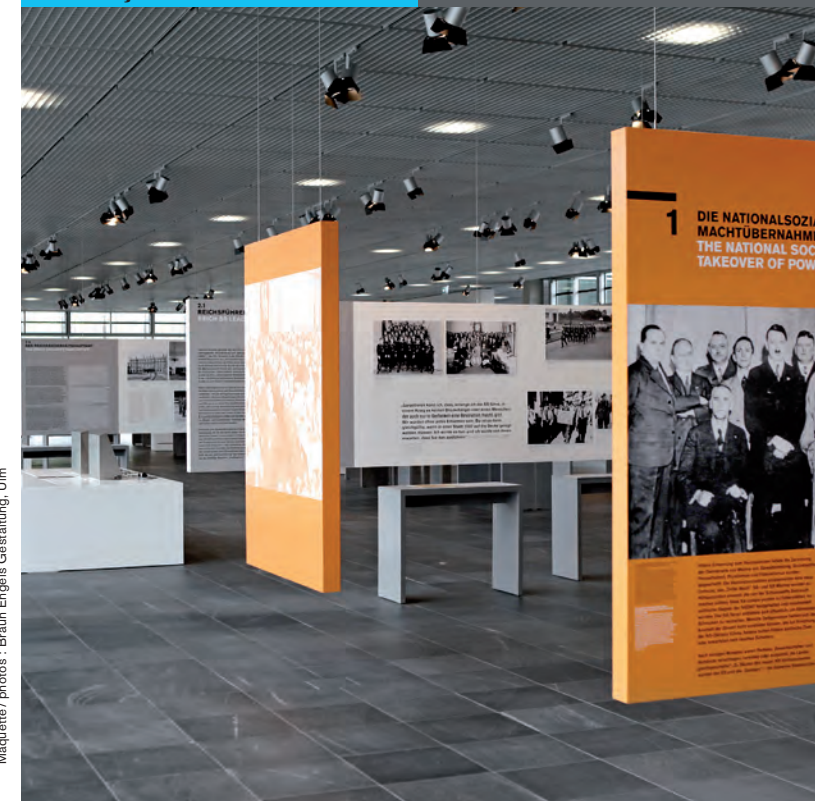
Maquette / photos : Braun Engels Gestaltung, Ulm