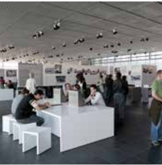
Hoveddelen af den faste tysk- og engelsksprogede udstilling er de centrale institutioner af SS og politiet i Nazityskland samt de forbrydelser, som de begik i hele Europa. Ud over en præsentation af gerningsmændenes terrorsystem viser udstillingen også de forskellige grupper af ofre for naziregimet.