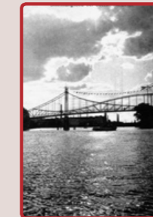
Der Kaisersteg um 1900

1898 wurde der Kaisersteg von der AEG errichtet, um ihren Arbeitern und Angestellten den Weg vom S-Bahnhof Schöneweide zu den AEG Fabrikhallen zu erleichtern. Im Volksmund wurde die Brücke auch „Schwindsuchtbrücke“ genannt, da sie nur drei Meter breit war und zu den Stoßzeiten bei Schichtwechsel leicht ins Schwanken geriet. Im April 1945 sprengte die SS diese und alle anderen Brücken in Schöneweide, um den Einmarsch der Roten Armee zu verzögern. Seit 2007 existiert die Brücke wieder als Fußgängerbrücke und verbindet Nieder- mit Oberschöneeweide.