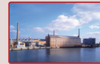
Blick auf die ehemaligen Industrieanlagen der AEG, 2008

Ende des 19. Jahrhunderts siedelten sich in Oberschöneeweide Fabriken der AEG an. Von großer Bedeutung waren dabei das älteste Drehstrom-Kraftwerk und das Kabelwerk Oberspree, die vielen Menschen Arbeitsplätze sicherten. Die Fabrikhallen an der Wilhelminenhofstraße sind geschmückt mit Symbolen von Energieträgern.