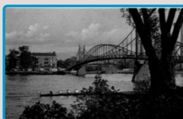
3 Kaisersteg, um 1910