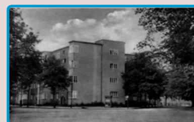
5 Spreesiedlung zur DDR-Zeit