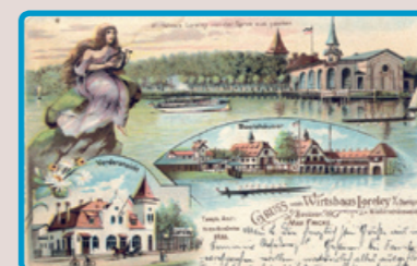
7 Wirtshaus Lorely mit Bootshäusern, um 1900