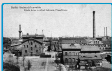
2 Die Fabrik der Gebrüder Lehmann, um 1890