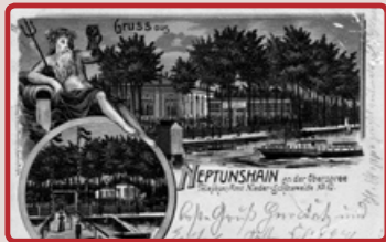
Gaststätte Neptunshain an der Oberspree, um 1890

In dem Wirthaus „Neptunshain“ auf der Sedanstraße 50 (heute Bruno-Bürgel-Weg 131-139) befand sich seit Juli 1942 ein Zwangsarbeiterlager. Die Zwangsarbeiter mussten bei der Präzisionszieherei Albert Pierburg arbeiten. Spuren auf dem heutigen Gelände des Kanu-Sportclubs Berlin e.V. lassen erkennen, dass vermutlich auch zusätzlich noch Baracken als Wohnunterkünfte errichtet worden sind.