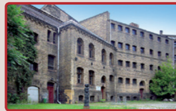
Ehemaliges Amtsgerichtsgefängnis, heute Gedenkstätte Köpenicker Blutwoche, 2007

Die Gedenkstätte „Köpenicker Blutwoche Juni 1933“ befindet sich heute im ehemaligen Gefängnis des Amtsgerichtes Köpenick. Während der Köpenicker Blutwoche beschlagnahmte die SA das Gefängnis, um es als zentrale Haft- und Folterstätte in Köpenick zu missbrauchen. Die SA führte in dieser Woche einen brutalen Kampf gegen Hunderte von Regimegegnern. Über 20 Menschen starben an den Folgen der Misshandlungen durch die SA. Die Gedenkstätte auf der Puchanstraße 12 ist immer donnerstags von 10-18 Uhr geöffnet.