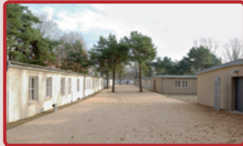
Das GBI-Zwangsarbeiterlager, heute Dokumentationszentrum NS-Zwangsarbeit, 2008

Auch in dem Industriestandort Schöneweide mussten während des Zweiten Weltkrieges zahlreiche Menschen aus allen Teilen West- und insbesondere Osteuropas Zwangsarbeit leisten. 1943 wurde an der Britzer/ Ecke Köllnische Straße ein Unterkunfts- lager aus Stein für über Zweitausend Zwangsarbeiter gebaut. Es ist das einzige in Berlin, das bis heute als Gesamtensemble erhalten geblieben ist.