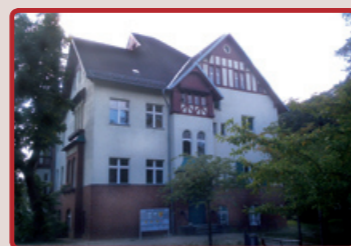
Villa Rathenau, 2008

1914 bis 1917 baute der Architekt Peter Behrens im Auftrag des AEG-Gründers Emil Rathenau ein neues Werk für die Nationale Automobilgesellschaft (NAG). Das Wahrzeichen der NAG ist der so genannte Behrens-Turm, der als bedeutendes Zeichen moderner Industriekultur gilt. Der Turm bietet einen beeindruckenden Blick auf das Industrie-Panorama in Oberschöneeweide.