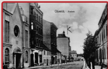
Die Synagoge in Köpenick, um 1910

Die 1910 errichtete Synagoge der jüdischen Gemeinde in Köpenick stand in der Freiheit 8. Heute erinnert nur ein Gedenkstein daran. Während der Pogromnacht im November 1938 plünderte die SA die Synagoge und steckte sie in Brand. Die Ruine wurde nach Kriegsende abgetragen.